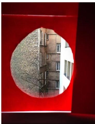
Le mur à sa taille réelle